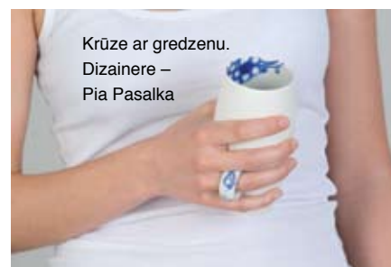
Krūze ar gredzenu. Dizainere – Pia Pasalka

Tējas servīze. Dizainere – Vera Vidermāne, dizaina studija DESIGNSTUDENTS FOR RENT® . www.designstudents-for-rent.at