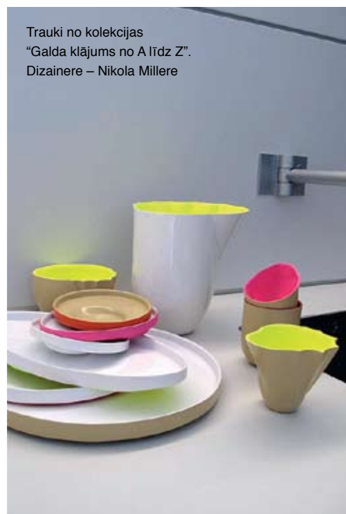
Trauki no kolekcijas "Galda klājums no A līdz Z". Dizainere – Nikola Millere