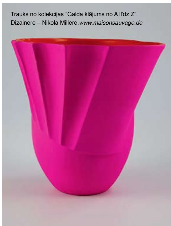
Trauks no kolekcijas "Galda klājums no A līdz Z". Dizainere – Nikola Millere. www.maisonssauvage.de

Servīzes un glāzes, krūkas un tasītes, katli un pannas, salvetes un dvieļi Frankfurtes mesē Ambiente servēti kā gastronomiskā pasākā, kur, kā smeļies, galdi jau klāti, tikai ēst nedod. Paviljonos rindoņas trauku armijas, bruņotas zeltā un kristālos, varavīkšņainās apdrukās vai ar nepierastām faktūru niansēm. Taču uz pārbagātā fona meses organizētāju izceltā jauno talantu ekspozīcija iezīmējas askētisma un funkcionalitātes nospraustajos ietvaros. Nekādas liekas greznības, vien koncepcijas noenkurojumam vai ikvienā trauku grupā piejaukts kāds visiem zināms kultūras tradīciju citāts, autoriem tomēr cenšoties iestrādātos stereotipus kaut nedaudz izsist no vispārpieņemtā līdzsvara.